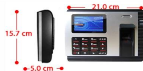
Diagrama de configuración