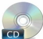
Software de Gestión de Asistencia